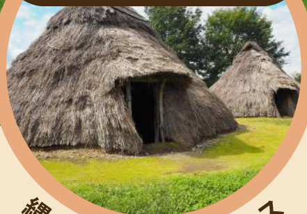
縄文・展示体験ブース