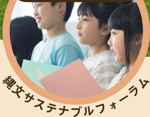
縄文サステナブルフォーラム