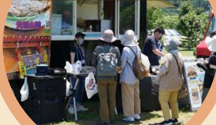
縄文サステナブルマルシェ